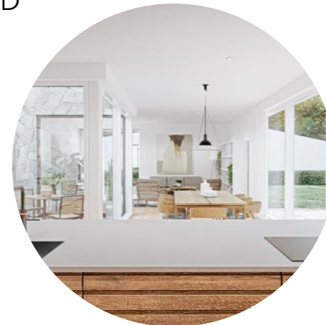
LYST OG RUMMELIGT