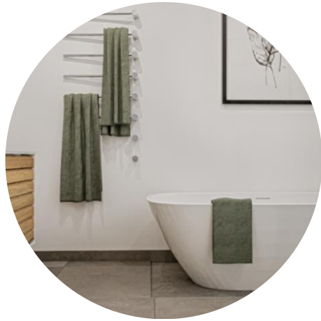
STORT MASTER BATHROOM